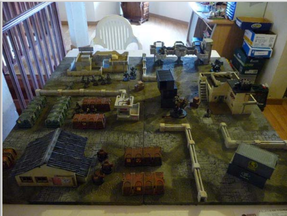
Une fois que le décor est en place, on oublie que la table de 120 par 120 est constituée de 4 planches de 60 par 60. Les jonctions sont partiellement masquées par les éléments de décor.