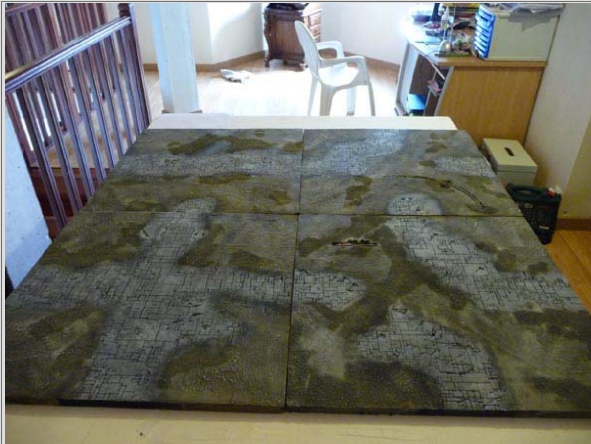
Voilà 4 planches de 60 par 60 cm