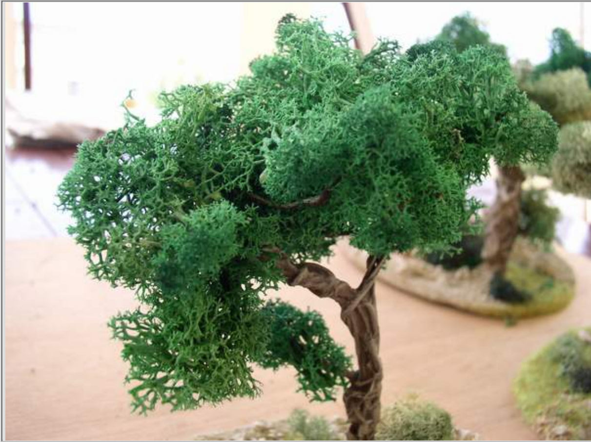
Un zoom sur le feuillage.