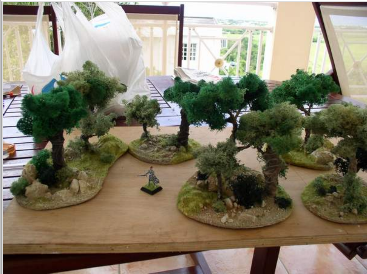
Voilà le travail final. J'ai réalisé 5 socles contenant 10 arbres au total. Pour aller plus vite il est préférable de fabriquer plusieurs arbres en même temps.